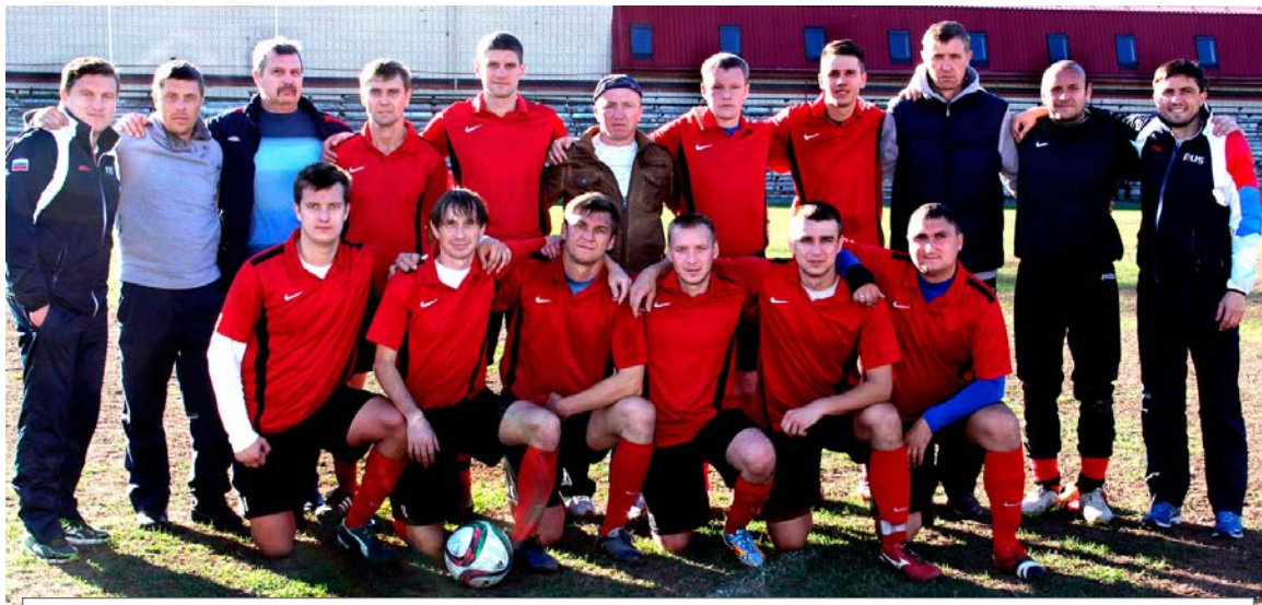
«СЕРЕБРЯНЫЙ» СОСТАВ «МЕТАЛЛУРГА»

- Это вообще отдельная и обидная история. Судья отменил забитый нами гол, причем правильно забитый, что подтвердила и видеозапись, которую мы послали в областную федерацию футбола. Там с нами согласились, но результат отменять не стали. Кстати, и в полуфинальном кубковом матче с «Автодором» повторилась та же история. Мы опять послали видеозапись в федерацию, которая признала ошибку судьи и даже сняла его с обслуживания игр до конца сезона. Но